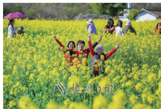
城東鎮石月村遍地金黃的油菜花吸引了不少遊客前往打卡。

時下,梅縣區城東鎮石月村三十多畝油菜花正恣意綻放,在青山碧草的映襯下顯得如油畫般絢爛,慕名而來的遊客紛紛停車駐足拍照留念,置身花海盡情享受大自然的美妙樂趣。“聽說現在正是觀賞油菜花的最好時期,約上幾個朋友來看看,一片金黃的田野匯集成花的海洋,隨手一拍都是‘大