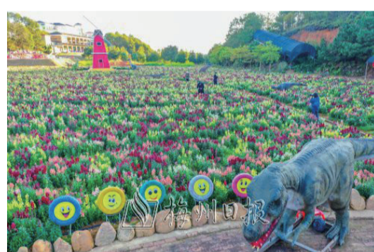
麓湖山盛開的金魚草花海五彩繽紛。

在梅縣區南口鎮麓湖山景區時花廣場,亦是滿園春色,粉紅色、紅色、黃色、白色等近20畝的各色金魚草開滿整個花田,呈現出的花海效果洋溢着春天的氣息。據景區工作人員介紹,金魚草的花期將持續到5月,色彩絢爛的金魚草吸引了許多遊客前來踏青賞花,不少攝影愛好者還特意帶了“長槍短炮”給花田拍照,留住春天的美麗。