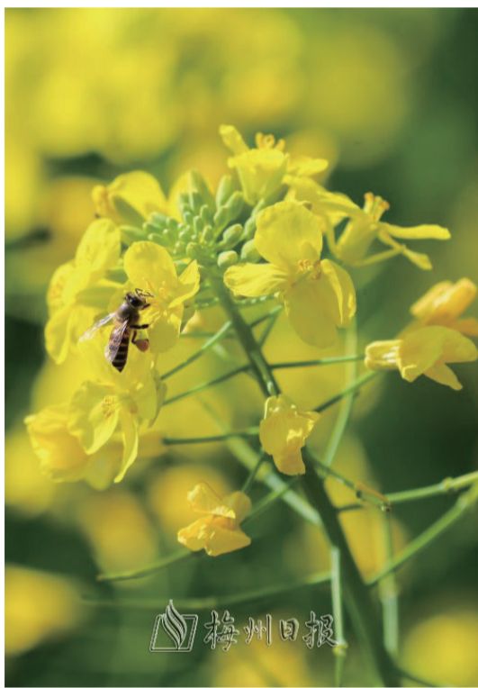
油菜花盛開,蜜蜂採蜜忙。

“春暖花開二月天,人間如詩畫芳華。”行走於梅縣大地,隨處可見櫻花、李花、鞭炮花、茶花、杏花、含笑花……一樹接着一樹、一枝壓着一枝,數不過來的顏色,賞不完的花,好一派花團錦簇、美不勝收的繁花景象。